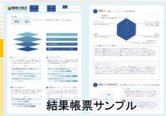
結果帳票サンプル